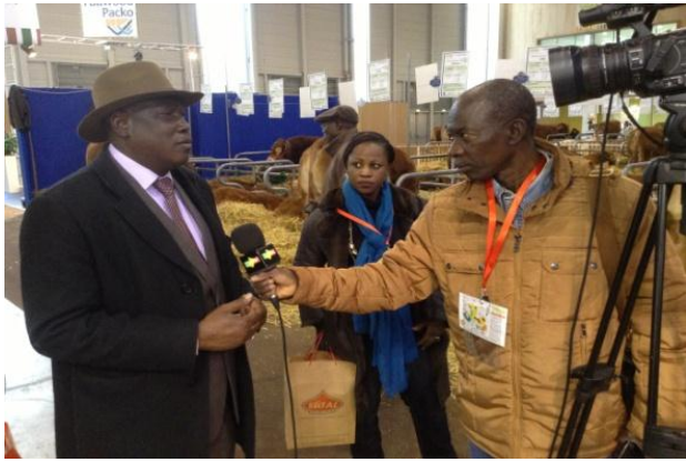
Interview du Président de l'APCAM lors des visites