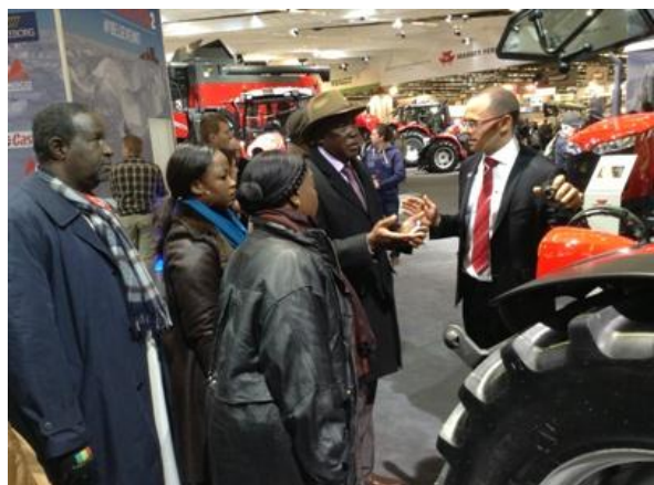
Visite de la délégation du Mali au SIMA