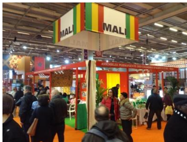
Vue générale du stand Mali

L'édition 2015 du SIA était organisée en Halls 8 présentant différents domaines Agricoles. Le Mali était présent dans le Hall 5.1 dédié à l'Agriculture et délices du monde en face du stand du Sénégal et de la Côte d'Ivoire.