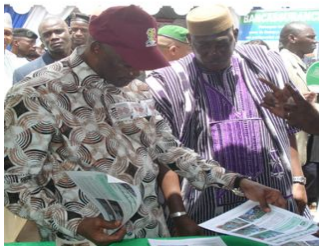
L'image du mois : Votre bulletin Cikela dans les mains du Président de la république du Mali, SE Amadou Toumani TOURE

Il a souligné que cette session sera pour lui, en tant que Président de l'APCAM, un des grands moments de l'histoire des Chambres d'Agriculture du Mali. De mémoire d'élu de la Chambre d'Agriculture depuis sa création, c'est la première fois que les représentants de toutes les régions du Mali et du District de Bamako élisent par consensus tous les membres des postes du bureau et les votent à l'unanimité. Cela est un exemple de maturité et de cohésion de la Profession Agricole.