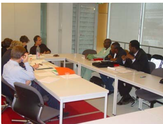
Rencontre avec l'AFD

A la fin de la mission, une réunion de synthèse a permis de préciser les grandes conclusions et surtout de dégager les axes de collaboration retenus entre l'APCA et l'APCAM qui feront l'objet de protocole entre les deux institutions. Ces axes sont les suivants :