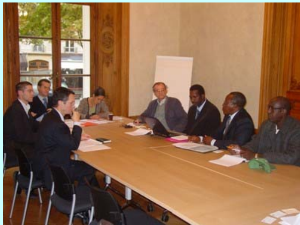
Réunion de synthèse

- Le renforcement du jumelage entre les Chambres départementales de France et les Chambres locales du Mali sur la base du volontariat.