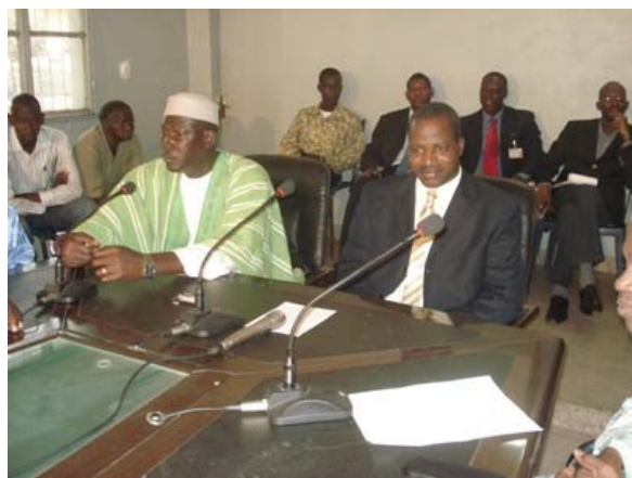
Le Présidium dans la salle de conférence de l'APCAM

Le Ministre a enfin exprimé toute sa volonté et son engagement d'œuvrer en faveur de la profession Agricole.