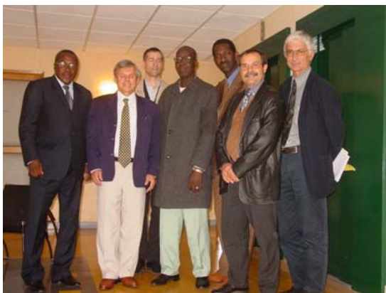
Rencontre avec Ministère de l'Agriculture et de la Pêche