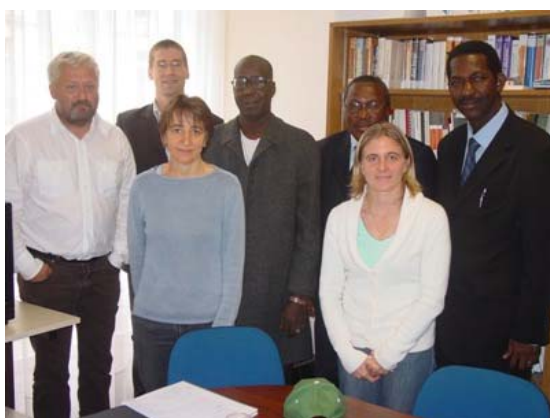
Rencontre avec l'AFDI National