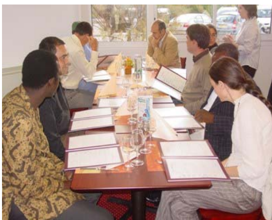
Rencontre avec l'AFDI régional de Loiret