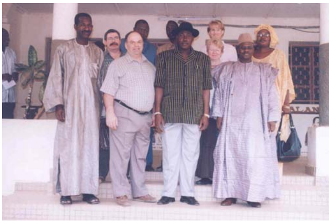
La délégation UPA-DI/APCAM avec le Gouverneur de la Région de Ségou

Au village de N8, une rencontre a eu lieu avec les producteurs rizicoles et les productrices d'échalote membre de Faso Jigi. Cette phase de terrain a été clôturée par la visite des magasins de conservation et de stockage d'échalote et des parcelles rizicoles du village de N8.