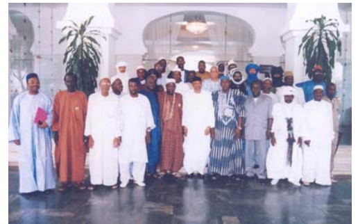
Les élus consulaires de l'APCAM et le Président de la République, Son Excellence Amadou Toumani TOURE (ATT)