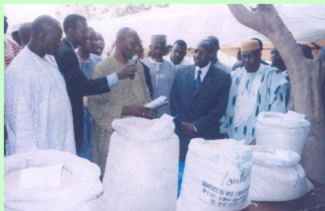
La délégation officielle visitant les produits exposés