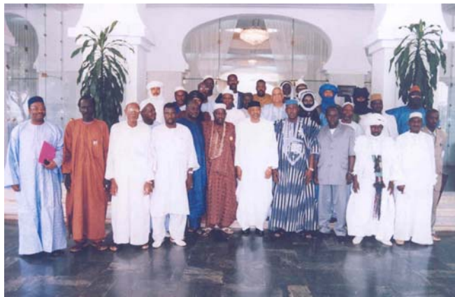
Les élus consulaires de l'APCAM et le Président de la République, Son Excellence Amadou Toumani TOURE ( ATT)

A la fin de la session, les élus consulaires ont été reçus en audience par le Président de la République, Son Excellence Amadou Toumani TOURE.