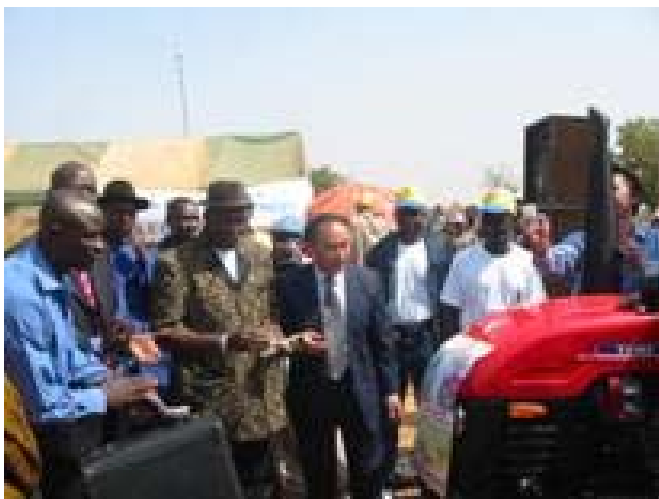
Cérémonie de remise de clés de 37 tracteurs

Le 29 décembre 2005 s'est déroulée à Sikasso la cérémonie de remise officielle de 37 tracteurs aux producteurs cotonniers dans le cadre de du contrat GSCVM-DTE et la pose de la première pierre d'une usine de montage de tracteurs et matériels agricoles par la Société Chinoise DTE-Mali.