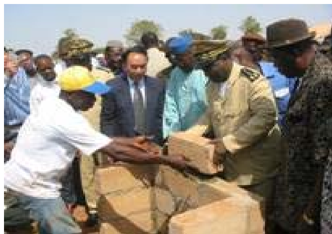
Cérémonie de pose de la 1 ere pierre d'une usine de montage de matériel agricole

En avant pour la mécanisation agricole au Mali !