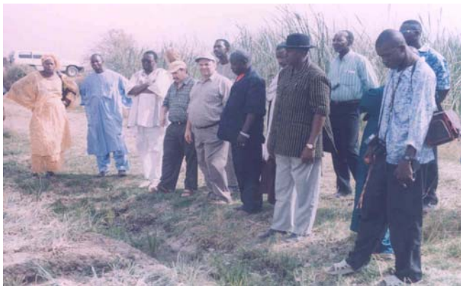
La délégation UPA-DI/APCAM dans les parcelles de N8

Au village de N8, une rencontre a eu lieu avec les producteurs rizicoles et les productrices d'échalote membre de Faso Jigi. Cette phase de terrain a été clôturée par la visite des magasins de conservation et de stockage d'échalote et des parcelles rizicoles du village de N8.